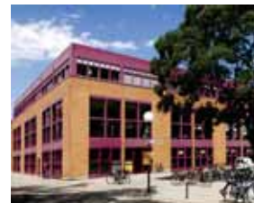
Baden-Württembergs Größte: Die Mensa Am Adenauerring!