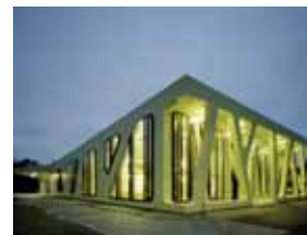
Baden-Württembergs Schönste: Die Mensa Moltke!