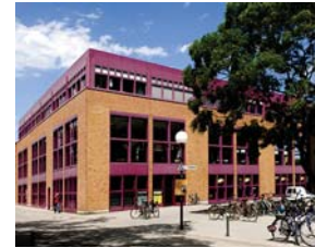
Baden-Württembergs Größte: Die Mensa Am Adenauerring!