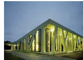
Baden-Württembergs Schönste: Die Mensa Moltke!