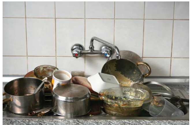
Erst wenn der letzte Topf verdeckt ist, erst wenn die letzte Gabel an schmutzigen Tellern klebt, werdet Ihr merken, dass ein Messi unter euch ist...

Am nächsten Morgen kommt mir der nächtliche Vorfall dermaßen absurd vor, dass ich zuerst ernsthaft in Erwägung ziehe, das Ganze nur geträumt zu haben. Doch ein Blick in die Küche genügt, um mich eines Besseren zu belehren. Wutentbrannt über so viel Egoismus klopfe ich aufgebracht an die Tür des Messies. Doch keine Reaktion. Anstatt dessen begegnen mir zwei Mitbewohnerinnen, die sich lautstark über das Chaos aufregen. „Wir müssen was tun!“, rufen sie aufgebracht. „Das kann so jedenfalls nicht weiter gehen!“ Eifrig nicke ich mit dem Kopf und befürworte