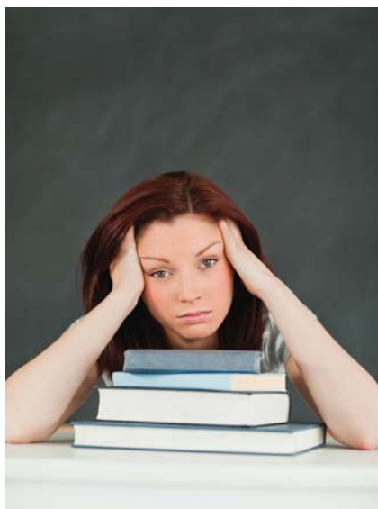
Aller Anfang ist schwer. Wir beraten Sie gerne, wenn alles zuviel wird

Anmeldung und Information: Montags bis Freitags jeweils 9–12.00 Uhr