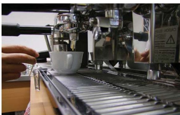
Wir freuen uns auf Ihren Besuch. Ihre Hochschulgastronomie.