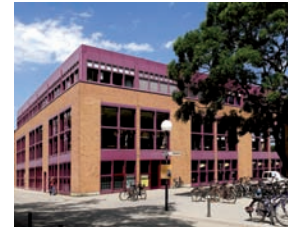
Baden-Württembergs Größte: Die Mensa Am Adenauerring!