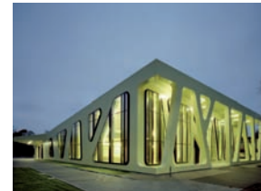
Baden-Württembergs Schönste: Die Mensa Moltke!