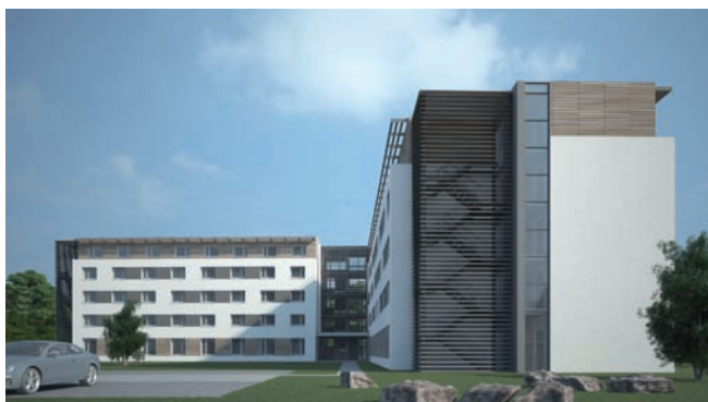
So soll es aussehen, das neue Wohnheim in der Tennesseeallee mit dem das Studentenwerk Karlsruhe einen Beitrag zur Entspannung der Wohnungssituation für Studierende leistet.

Das Deutsche Studentenwerk sieht zum Beginn des Wintersemesters 2011/2012 die Studierenden in vielen Hochschulstädten allerdings in einer schwierigen Lage bei der Suche nach einer bezahlbaren Bleibe. Viele der 58 Studentenwerke, die im Deutschen Studentenwerk (DSW) organisiert sind, melden angesichts der