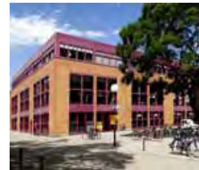
Baden-Württembergs Größte: Die Mensa Am Adenauerring!