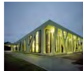
Baden-Württembergs Schönste: Die Mensa Moltke!