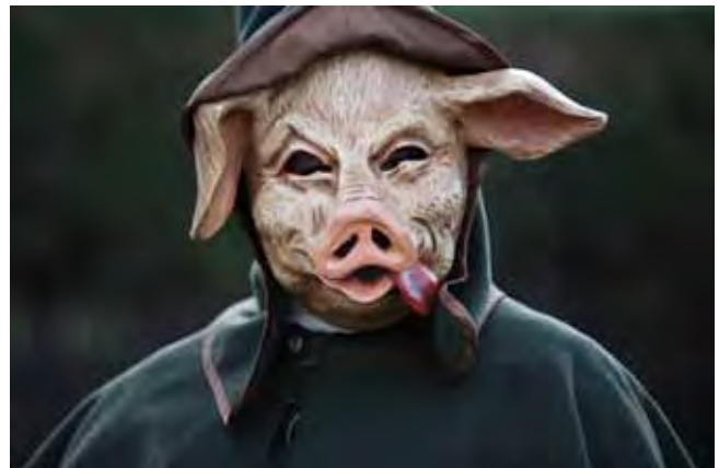
Sau raus – Sau rein – wer wirst du sein?

Mal Hand auf's Herz: Dir ist es relativ egal, ob gerade Faschingszeit ist, oder nicht. Du siehst das Ganze eher als einen guten Anlass, wieder richtig auf die Piste zu gehen und die Sau raus