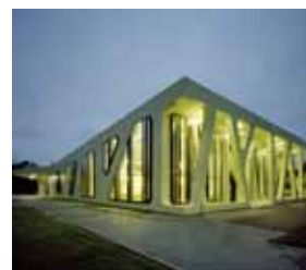
Baden-Württembergs Schönste: Die Mensa Moltke!