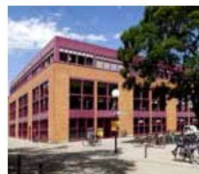
Baden-Württembergs Größte: Die Mensa Am Adenauerring!