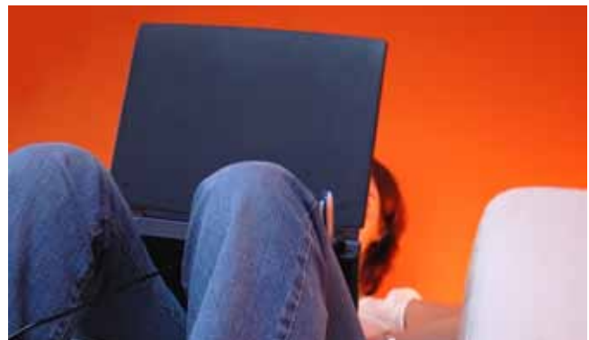
Der beste Weg zum Studentenwerk beginnt auf Deiner Couch!

Theater, Konzerte, Japantage, Kino, Workshops – das Angebot an studentischer Kultur ist in Karlsruhe sehr vielfältig. Hier lohnt auf jeden Fall der Blick auf die Internetseiten.