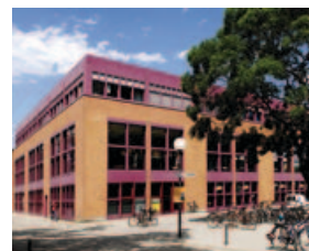
Baden-Württembergs Größte: Die Mensa Am Adenauerring!