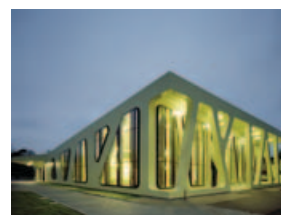
Baden-Württembergs Schönste: Die Mensa Moltke!