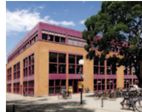
Baden-Württembergs Größte: Die Mensa Am Adenauerring!

Mensa Holzgartenstraße Mo-Fr 11.30-13.30 Uhr