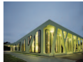
Baden-Württembergs Schönste: Die Mensa Moltke!